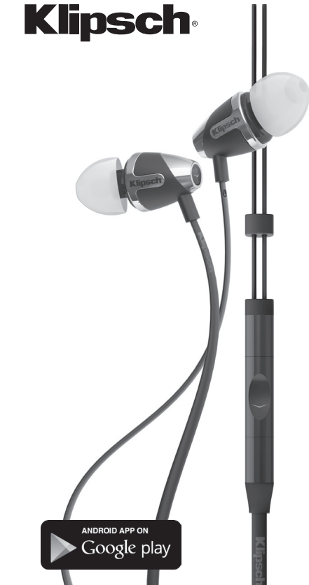
Image S4A Headphones