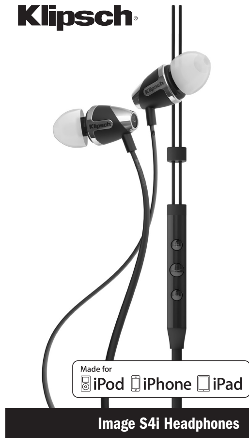
Image S4i Headphones